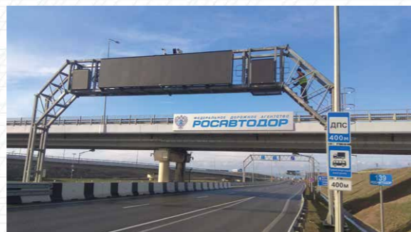
Расположение комплекса на специальной ферме (Крымский мост)