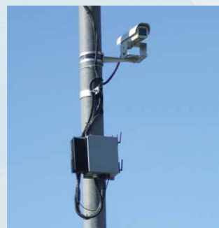
Расположение комплекса на стандартной опоре освещения